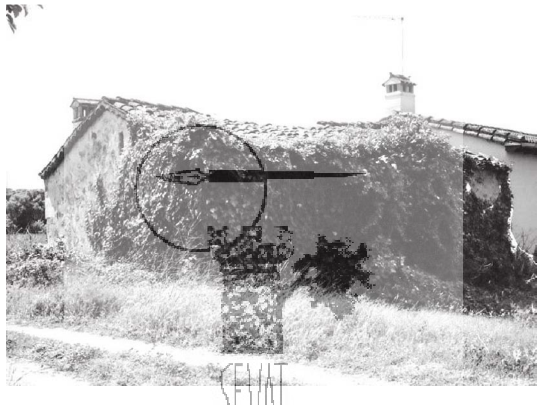
Ramacastañas. Ruinas de la ermita de Nuestra Señora de los Remedios. (Foto: Vidal Ramírez).

Tres fanegas y media de huerto de regadío de primera calidad; una fanega y nueve celemines de tierra de regadío de primera calidad. Cerca de secano, siete celemines de primera calidad; de segunda, cuatro fanegas y media. Y de tercera, una fanega y media. Tierras de secano de tercera calidad treinta y nueve fanegas y media. Prados de secano de tercera calidad, seis peonadas y media. Viñas de segunda calidad, dos peonadas. De tercera, otras dos. De castaños de segunda calidad, una medida. De tercera calidad, dos y sobran diecisiete pies de la misma.